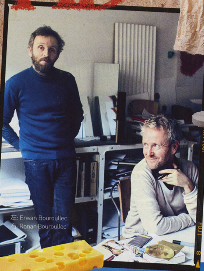
左: Erwan Bouroullec 右: Ronan Bouroullec